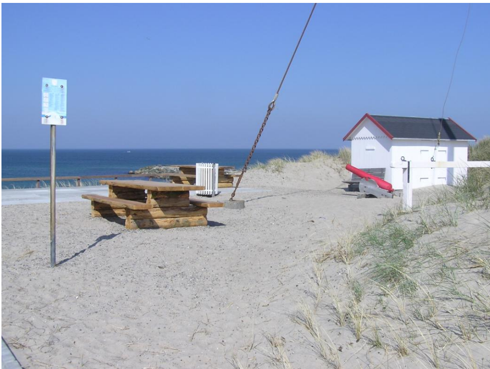
Signalstationen i Agger med kanon.

Skriv en avisartikel om Chresten Grøns beskydte hus.