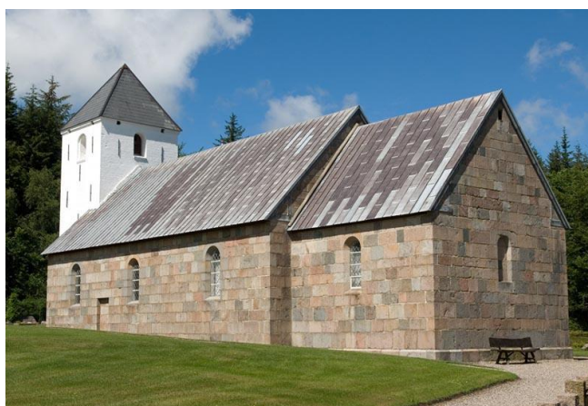
Tved Kirke i Nationalpark Thy, foto Henrik Bolt-Jørgensen

http://www.denstoredanske.dk/Kunst_og_kultur/Religion_og_mystik/Reformationen_og_lutherske_kirke/kirke/kirke (Kirkearkitektur)