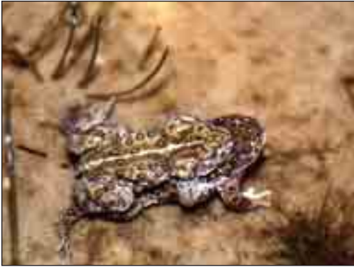
Ynglende strandtudser. Strandtudsen har en karakteristisk gul rygstribe.

der findes et tørt sydvendt område med lav vegetation, hvor parringsspillet og parringen kan foregå om foråret. De parrede hunner bliver nær parringsområdet, medens hannerne og de uparrede hunner kryber op til 2 km ud i landskabet til deres sommerkvarter.