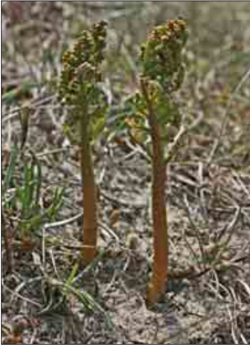
Kamillebladet månerude er en uhyre sjælden plante, som er i fare for at forsvinde fra den danske natur. I 2006 fandtes nogle få eksemplarer i klitområdet ved Lyngby.

I områder med mere eller mindre blottet sandbund har man mulighed for at finde en del af vore mere sjældne sivarter, som dværg-siv, fin siv, spidsblomstret siv og den meget sjældne stilk-siv.