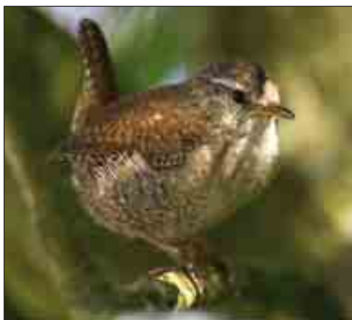
Gærdesmutten har sandsynligvis altid ynglet hos befolkningen i klitlandskabet. Nu er den en almindelig ynglefugl i klitplantagerne.