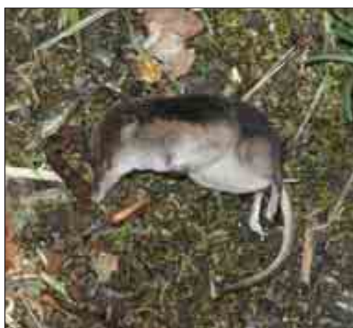
Almindelig spidsmus udskiller fra sine sidekirtler en stærk lugt, som bruges til kommunikation. Lugten virker desuden frastødende på mange rovdyr, og derfor finder man undertiden døde dyr efterladt i naturen.

Åbningen af Nationalpark Thy vil forhåbentlig forøge interessen for dette særlige landskab og dets pattedyrfauna, og måske endda resultere i et endnu bedre kendskab til pattedyrenes forekomst i området.