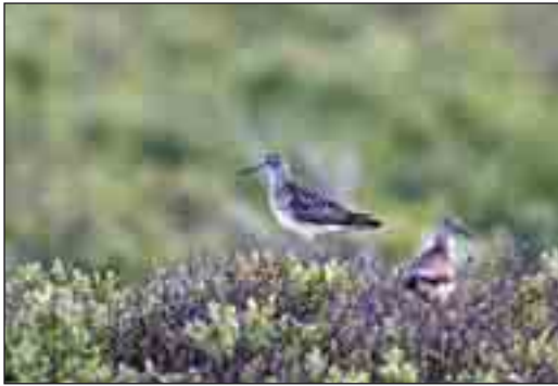
Tinksmeden var tidligere meget almindelig i klitlandskabets vådområder. Takket være Skov- og Naturstyrelsen Thy's arbejde med at bevare vådområder, er nedgangen stoppet, og arten er nu i fremgang som ynglefugl.

Den svindende bestand af ynglende hjejler i Thy, især i Hanstholm Vildtreservat, fik beklageligvis også besøg af ægsamlere, således den 23. maj 1948, hvor samleren tog et kuld på tre æg og noterede fig.: ”Reden lå i ganske kort lyng, græs og lav på et tørt stykke. Fuglen lettede på 3 meters afstand, før vi fik øje på den.” Det var heller ikke gavnligt for denne udsatte art, at skovdistriktets daværende ledelse tillod ornitologers besøg i reservatet i fuglenes yngletid. Hjejlen må være den vigtigste ”ansvarsart” for Nationalpark Thy.