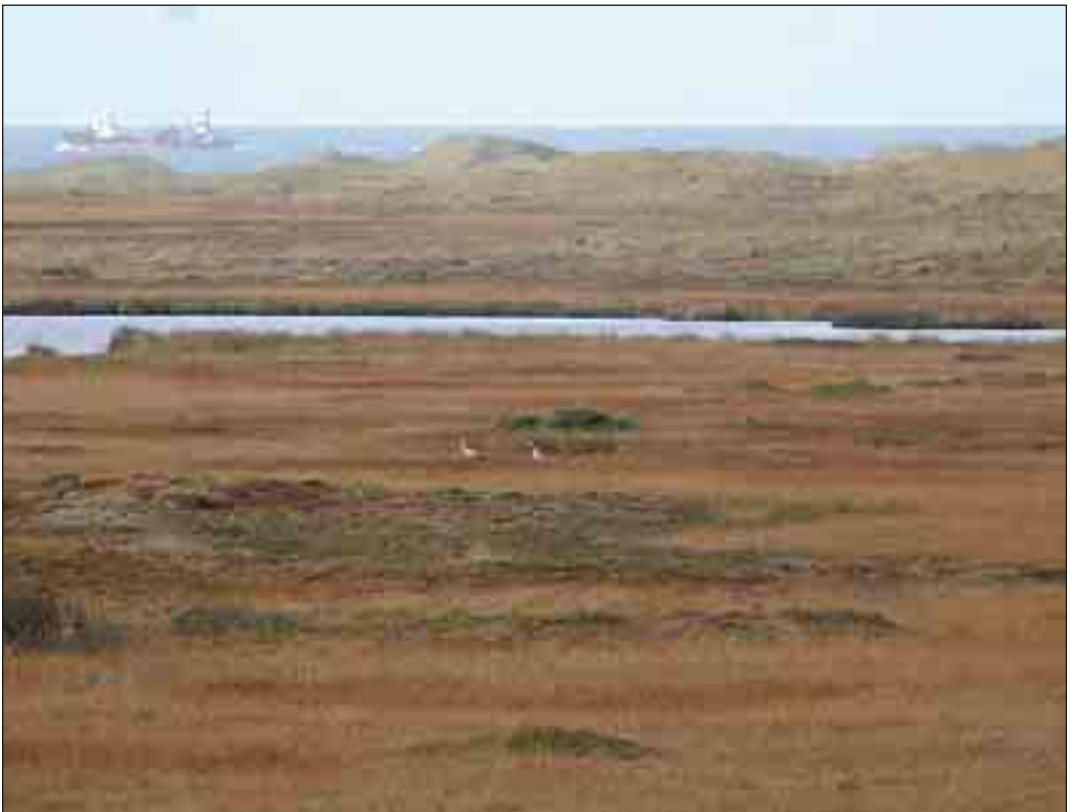
Traner i det store klitlandskab i Hanstholm Vildtreservat.

Forfatterens adresse: Holger Søndergård Hanstholmvej 64, Tved 7700 Thisted hs.tved@mail.dk