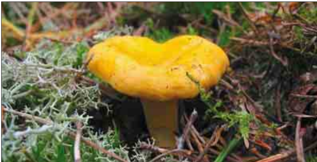
Almindelig kantarel – Fra midten af juni til den første frost.

Det er specielt de lysåbne klithedelandskaber, som er uudforskede. Det er derfor håbet, at Nationalpark Thy vil tiltrække både studerende og forskere, så vi med tiden kan udgive en samlet oversigt over svampesamfund og arter i nationalparken.