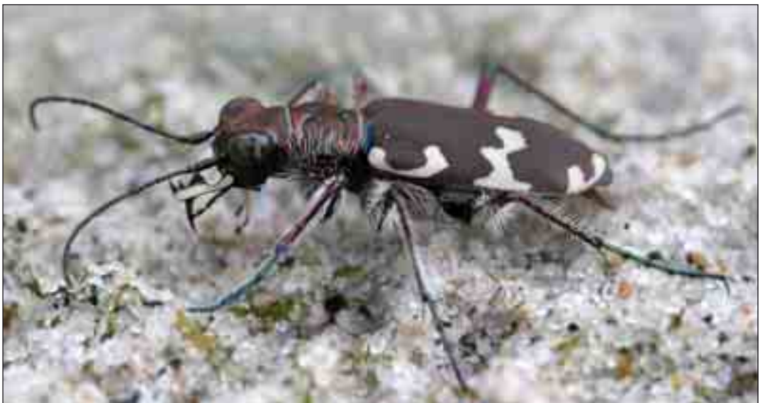
Klitsandspringer. Sandspringere er rovdyr, som overfalder andre insekter.