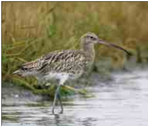
Storspoven indvandrede til klithederne i 1960'erne. Her blev den en almindelig ynglefugl, men den har været i tilbagegang siden 1990'erne.

I dette landskab, der veksler mellem åbne heder og klitplantager, lever en række fugle- og dy-