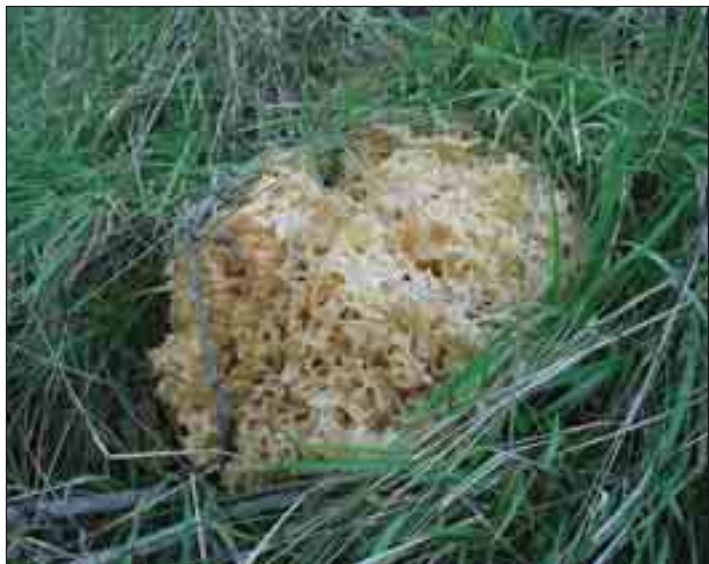
Nederst: Blomkålsvamp – På stubbe eller rødder af hovedsagelig sitkagran. Fra august til oktober. Spiselig.

bitter korkpigsvamp er indikatorer for fyrreskov på flyvesand.