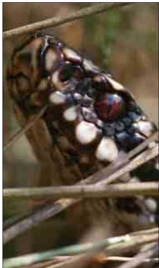
Portræt af en hugorm.

Forfatterens adresse: Lars Christian Adrados Årup Byvej 44 7752 Snedsted lca@amphiconsult.eu