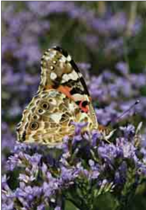
Tæt blomstret hindebæger tiltrækker masser af sommerfugle i blomstringstiden. Her er det en tidselsommerfugl der er på besøg.

værdier med arter, som ikke træffes andre steder i Thy. Den smukke tæt blomstret hindebæger har her et par mindre bestande i bunden af saltvandslagunen. Mange steder i strandengen på østsiden af saltvandslagunen og i området nordøst for den gamle havn ses de blågrønne pudeformede bevoksninger af stilkløs kilebæger, som her har sin nordlige forpost på vestkysten. I samme område findes også strand-rødtop, smalbladet kællingetand og udspilet star, som også her har sine eneste forekomster i Thy.