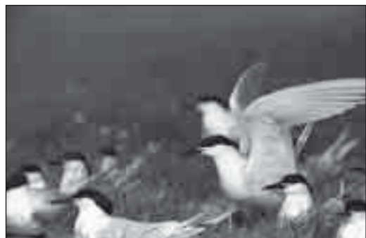
Splitternen ynglede på Agger Tange frem til ca. 1980.

Splitternen og sandternen forsvandt som ynglefugle i Thy i henholdsvis ca. 1980 og ca. 1974, hvor begge arter ynglede i mindre kolonier sammen med kolonier af hættemåger på Agger Tange. Sandternen var meget knyttet til det åbne klitlandskab, hvor den fouragerede. De sidste kolonier af splitterner var på sydspidsen af Svanholm, mens de sidste sandterner ynglede på strandengene. Splitternen yngler fortsat i nogle kolonier andre steder i Danmark, mens sandternen er ved at forsvinde som dansk ynglefugl i disse år.