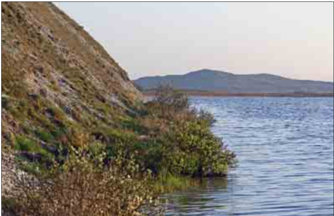
Kalkskrænten ved Blegso i Hanstholm Vildtreservat står som et minde om Litorinahavets kystlinie.

I klitternes vådområder er tilgroningen også fremmet af den luftbårne tilførsel af næringsstoffer, men samtidig overbelastes de af store flokke af gæs, der hvert forår og efterår opsøger især vådområderne i Hanstholm Vildtreservat og på Ålvand Klithede. Gæssene fouragerer i vid udstrækning inde på landbrugsarealerne, hvorefter de søger fred og ro i de våde klitområder, hvor de gøder de ellers næringsfattige klitlavninger og