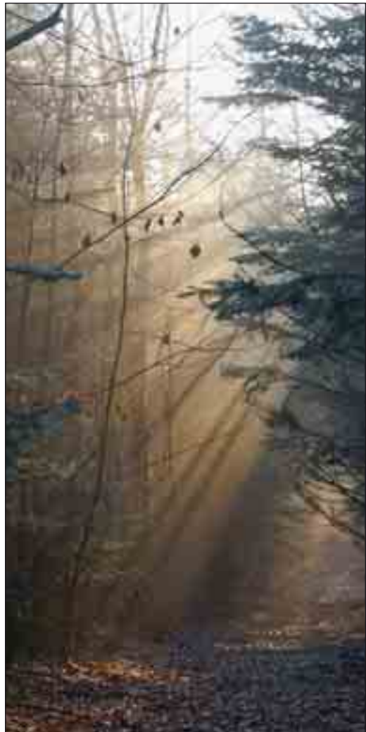
Lyset trænger gennem blandingsskoven i Vilsbøl Plantage.

Siden har sitka-gran overhalet udbredelsen af bjergfyr, der til stadighed bliver udskiftet med andre nåletræer som ædelgran og skovfyr. Desuden sker der i stigende grad indplantninger med løvtræer, og de udgør nu over 10% af klitplantagernes samlede udstrækning. Hovedparten af løvtræerne udgøres af eg, men efterhånden indgår også en del andre hjemmehørende løvtræer.