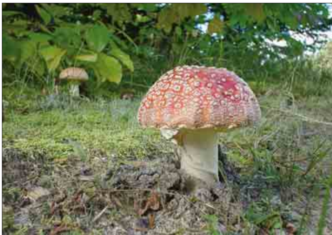
Rød fluesvamp – Almindelig under gran og birk fra august.

Forfatterens adresse: Ib Nord Nielsen Skov- og Naturstyrelsen Thy Søholtvej 6 7700 Thisted inn@sns.dk