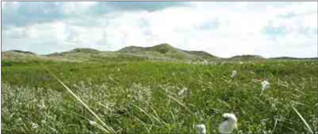
Fugtig klitlavning på Vangså Klithede med smalbladet kæruld og gråris.

klitsøer i sådan en grad, at det naturlige system ”kollapser”.