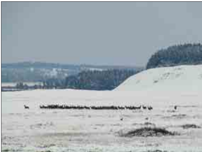
Kronndyr-rudel ved Sårup i Hanstholm Vildtreservat.

Rævens menukort er lang, og specielt for hedernes sårbare og fåtallige ynglefugle er den en betydelig prædator. I vildtplejen indgår derfor regulering af ræve som en del af forvaltningspolitikken, dog under skyldig hensyntagen til, at ræven også er en naturlig del af områdets dyreliv.