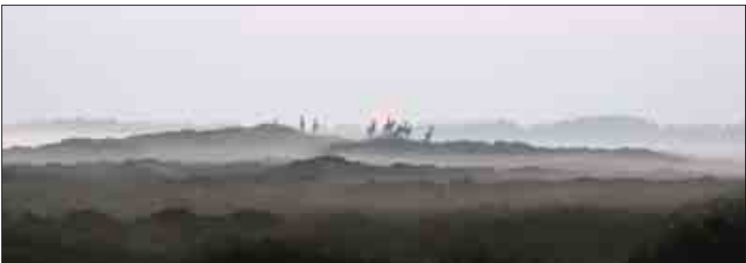
Kron dyr.

Ræven holder meget til på hederne og i plantagerne, hvor den hele døgnet kan færdes relativt uforstyrret rundt. Den bruger meget tid på at fange mus og andre gnavnere, og i det hele taget tage, hvad den tilfældigvis falder over på dens vej. Den spiser æg og unger fra fuglereder, harekillinger, rålam m.m. Den løber også ned til havet, hvor den prøver at finde noget spiseligt på stranden, så som opskyllede døde sæler, marsvin, fisk og fugle. Inden den ved dag gry vender tilbage til heden eller plantagen, skal den også lige rundt til gårdene for at tjekke, om der er noget spiseligt.