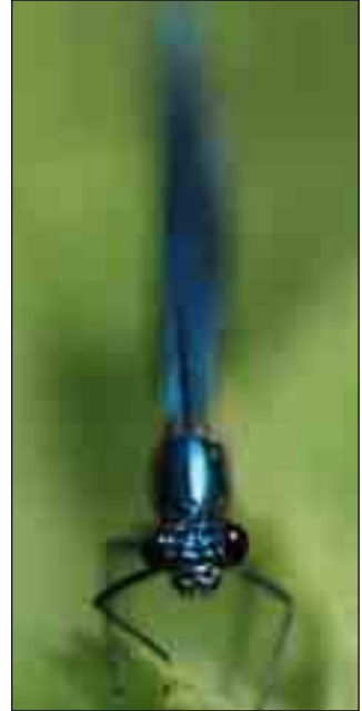
Blåbåndet pragtvandnymfe findes blandt andet i Klitmøller å.