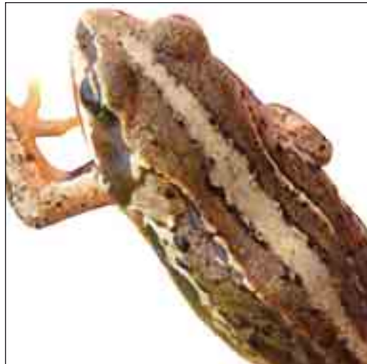
En sribet variant af spidssnudet frø.

Markfirben findes i alle klitter og klitheder i Nationalpark Thy med en bestandstæthed på vurderet mellem 5 til 15 dyr/hektar. Arten er meget stedtrofast og indvandrer kun til et nyt område, hvis unge dyr på grund af stor bestandstæthed presses ud af den eksisterende ældre bestand. At markfirben allerede i foråret 2005 fandtes i større antal i området, hvor Stenbjergbranden i juni 2004 fortærede klitplantagen, viser, at i hvert fald dele af klitplantagerne har tilpas lysåbne partier til, at