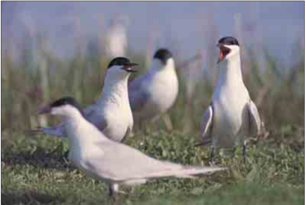
Den nu forsvundne art, sandternen, ynglede på Agger Tange indtil begyndelsen af 1970'erne.