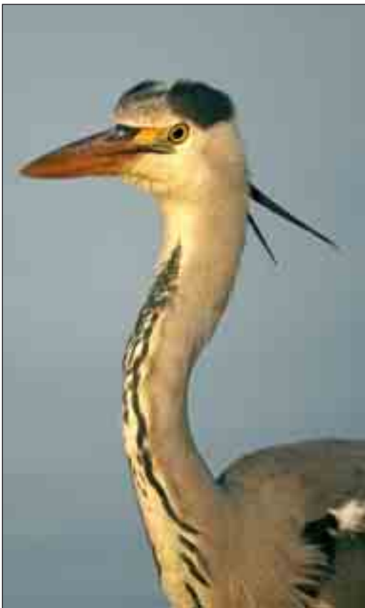
Fiskehejren, som nu er almindelig i Thy, indvandrede først til landsdelen som ynglefugl i 1950'erne.

Det var tidskrævende, og ikke mindst meget besværligt, at besøge det dengang helt ukendte og vidtstrakte klitlandskab. Thy lå meget afsides, selv for datidens få naturhistorikere med embeder, og der var kun enkelte, kyndige amatører, som havde økonomiske midler til rejser og ophold. De kom næsten alle fra København, og de besøgte først og fremmest de kendte fuglelokaliteter, og de lå uden for nutidens nationalpark. Næsten alle de besøgende var samlere. De gik meget grundigt til værks med deres salongeværer (til patroner med små hagl), som de nedlagde ynglefugle med (til skindlægning eller udstop-