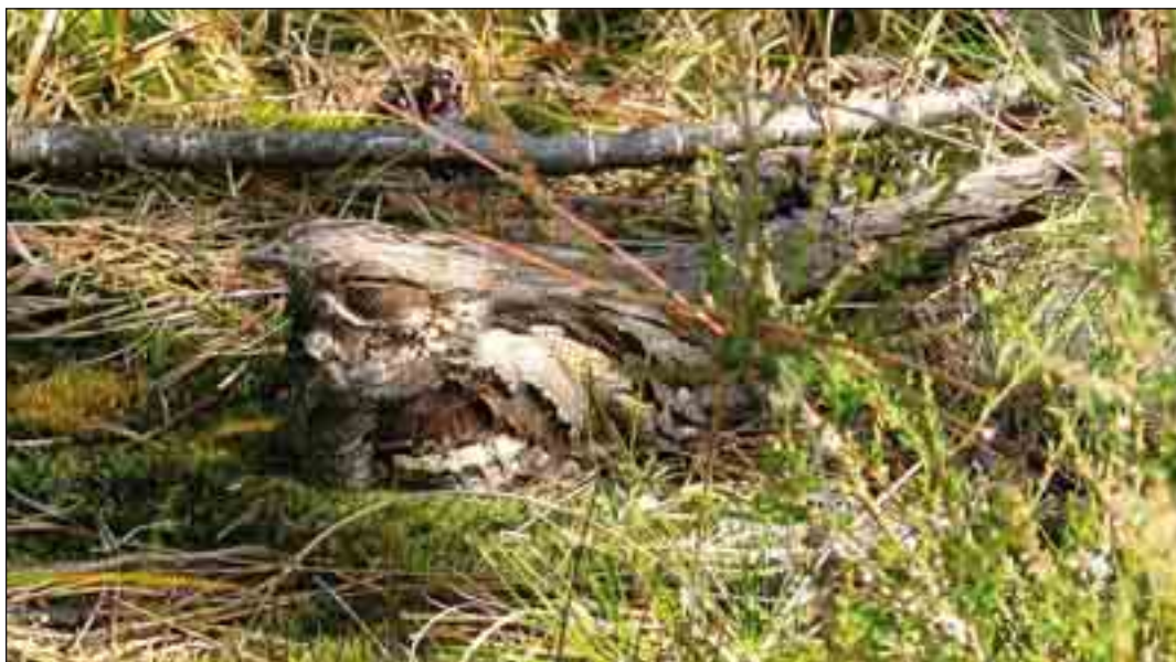
Natravnen har sin rede på jorden, og er derfor afhængig af sin camouflasje.

Man kan også lugte hjortene i brunstperioden. Rundt omkring på lavere fugtige arealer i skovene og på hederne har hjortene lavet "sølehuller", hvor de dels skraber med klovene, dels roder den fugtige jord op til et fint mudderbad med geviret. Bagefter ruller de sig heri – vel at mærke efter at de har tisset godt og grundigt i badet! Brunsthjorten bliver helt mørk i farven og lugter ganske voldsomt. En adfærd, der formentlig tilkendegiver over for andre hjorte, at han er stærk og farlig – og hinderne kan slet ikke stå for hans "parfume"!