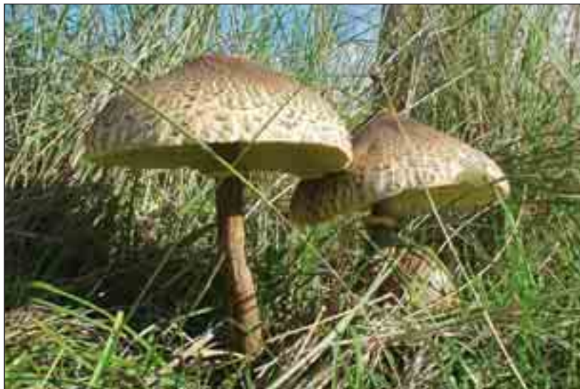
Stor parasolhat.

interesseredes opmærksomhed: Bævresvampe, barksvampe, poresvampe, kantareller, pigsvampe, køllesvampe, østershatte, rørhatte, bladhatte, skørhatte, mælkehatte m.fl.