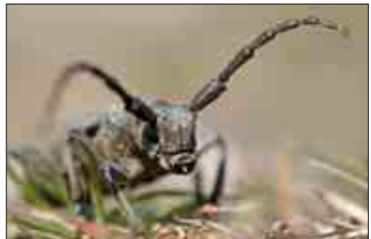
Væveren tilhører gruppen af træbukke, og er knyttet til den lave pileart, gråris, som vokser i klitheden. Den to centimeter store bille kan fra juli til september ses kravlende langsomt på jorden.