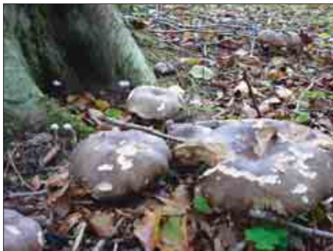
Sværtende skørhat – I løv- og nåleskov. Fra juli – oktober.

På klitheden er sandjorden så udvasket, sur og næringsfattig, at blomsterplanterne kun er sparsomt til stede, hvorved de mere konkurrencesvage, jordboende laver får mulighed for at dominere. De mest markante laver tilhører slægten Cladonia , der rummer bægerlaver og rensdyrlaver, som f.eks. spættet bægerlav og mild rensdyrlav.