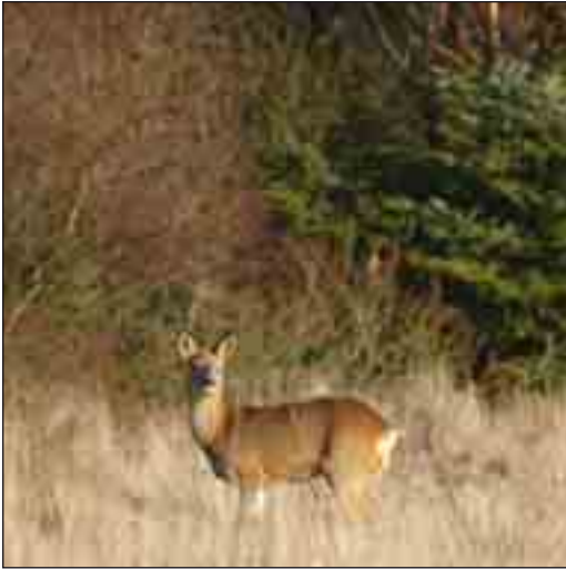
Rådyr ses ofte, når de græsser på åbne arealer.

Der er delte meninger om, hvor stor en velsignelse, det er at have fået kron dyr til Thy. Når bestandene begynder at blive store – alene inden for Nationalpark Thy er der 400-500 dyr, bliver der skader på skov- og markafgrøder. Skaderne er enkelte steder ganske store, og der er ingen muligheder for at få dem erstattet. Indtægterne fra jagtudleje er generelt steget til det dobbelte i Thy, efter at kron dyrene er kommet, og i områder med mange dyr er priserne steget til det tre- eller firedobbelte. Med de højere indtægter ved jagtudleje ”tjenes der således ind på gyngerne, hvad man har sat til på karrusellerne”, og så længe dette går nogenlunde lige op, er alle for så vidt tilfredse.