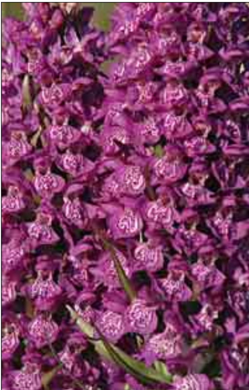
Purpur-gøgeurt optræder af og til som en pionerplante på kystnære lokaliteter - som her på Agger Tange. Efter en årrække kan den pludselig forsvinde igen.

I dag sker forvaltningen af Skov- og Naturstyrelsens ca. 18.000 ha inden for den kommende nationalpark efter Driftsplan for Skov- og Naturstyrelsen Thy 2007-2021 og med rådgivning fra Brugerrådet. Arealer omkring Agger og Agger