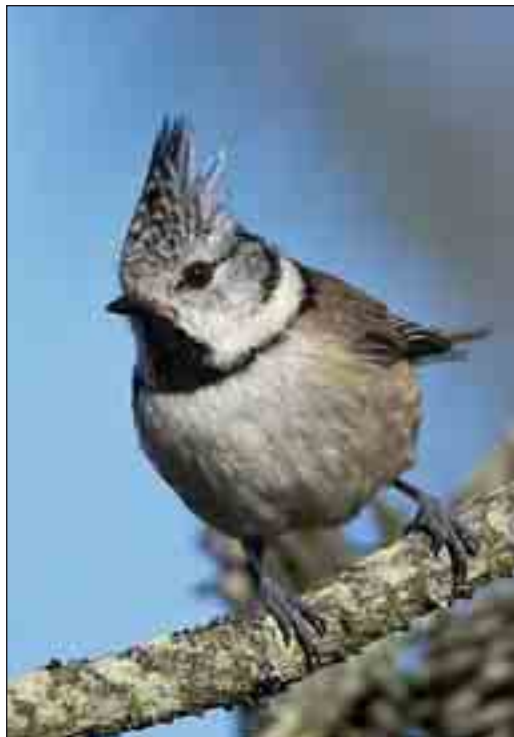
Topmejsen kom med klitplantagerne, og her er den nu en almindelig ynglefugl.