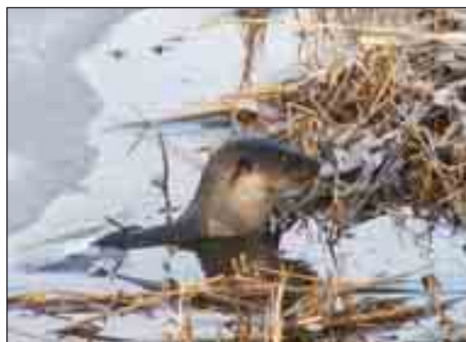
Odderen er blevet et almindeligt rovdyr i nationalparken.

Et nyt rovdyr, minken, har i de senere år indfundet sig i den danske fauna. Minken stammer oprindeligt fra Nordamerika, og blev indført til Skandinavien i 1930'erne som farmdyr. Undslupne mink fra farmene udgør i dag en væsentlig trussel for de fuglearter, der lever i tilknytning til søer, vandløb og moseområder. At det drejer sig om mange dyr, viser et fangstforsøg, udført af Thy Statsskovdistrikt i perioden 1998-2000, hvor der i 100 fælder på 15 måneder blev fanget 215 mink.