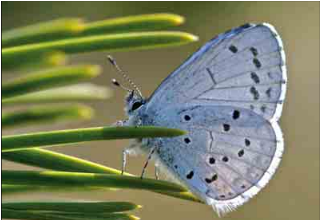
Skovblåfuglen er almindelig, og er den første af blåfuglene, som flyver. Den kan ses allerede fra sidst i april.