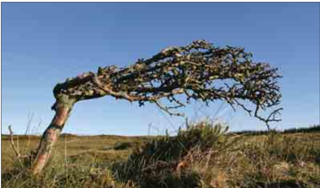
Hvidtjørn på Isbjerg i Hanstholm Vildtreservat. Skulle man miste orienteringen i den godt 24.000 hektar store nationalpark, kan man ofte få hjælp af naturens vejvisere.

Alle er formentlig enige om, at områdets natur skal sikres og gerne forbedres. En forudsætning herfor er imidlertid, at man har et nøje kendskab