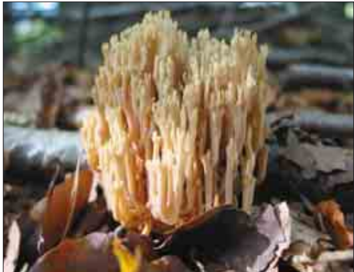
Rank koralsvamp – På grene af løvtræ fra august til oktober.

Uden at begynde på en opremsning af de næsten utallige arter, som kan findes i en klitplantage, vil fyrreskoven på flyvesand blive brugt som eksempel på et ganske særligt flor af svampe, karakteriseret af ægte ridderhat, der halvt udfoldet bryder op af sandede skovveje, grå ridderhat, skællet ridderhat m.fl. Også en række af pigsvampformede frynsesvampe, tragtformet læderpigsvamp og