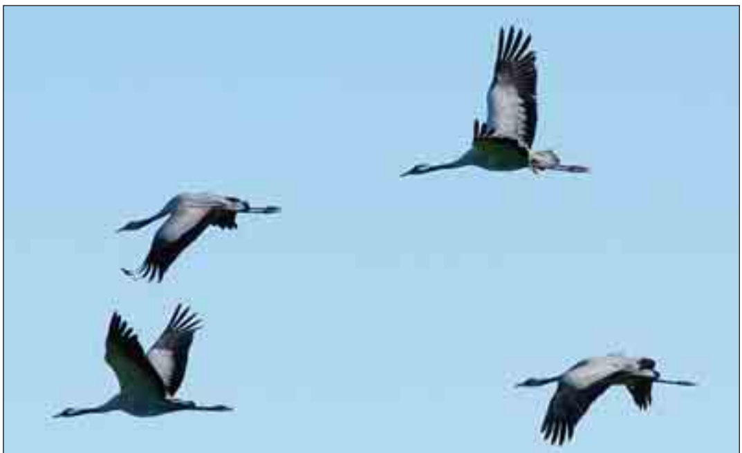
Fire flyvende traner.

Tranen er en stor fugl, der med dens lyse, blålige farve er forholdsvis let at få øje på, når den bevæger sig søgende efter føde rundt langs søer og kær. Ikke desto mindre er det fantastisk at se, hvor "usynlige" et tranepar kan være i yngletiden, også når det går rundt med nyudrugede unger. Så snart det fornemmer, der er mennesker i området, er parret "som sunket i jorden". Når ungerne først er halvstore, bevæger parret sig meget rundt. Tranerne går ikke af vejen for at svømme tværs over klitsøerne, ligesom det flere gange er konstateret, at hannen har jaget en nærgående ræv væk. Han går mellem sit kuld og ræven og indtager truepositur og ved gentagne gange at løbe mod ræven med hævede vinger, trækker ræven sig til sidst tilbage og forsvinder.