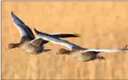
Grågåsen er de senere år blevet en meget almindelig fugl i Thy, både som ynglefugl og som trækfugl.