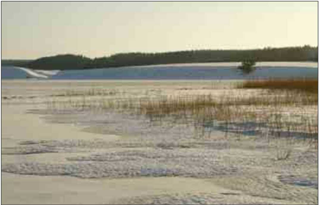
Nors Sø i vinterdragt, den 22. januar 2006. Foto: Poul Holm Pedersen.

I områdets nordlige del findes flere markante skræntpartier, der tidligere er blevet eroderet af