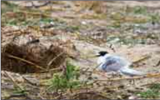
Dværgterner yngler på strandarealer. I nationalparken yngler den kun på Agger Tange.

Med et nyt landsdækkende minkprojekt, der løber frem til udgangen af 2008, søger man at belyse, i hvilket omfang undslupne, vildtlevende mink optræder i Danmark. Efter projektperiodens udløb udarbejdes der en handlingsplan for, hvordan problemer med mink løses. Mink kan meget vel vise sig at være ”tungen på den biologiske vægtskål”, da en stor del af vore ynglende vandfugle er gået drastisk tilbage i de senere år.