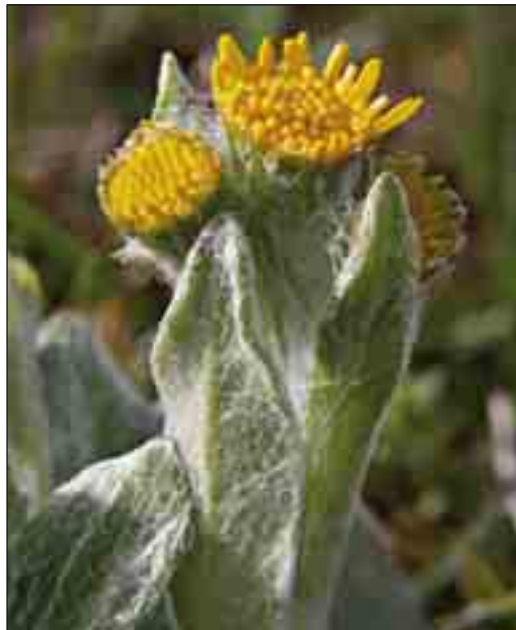
Bakke-fnokurt er en sjældenhed, som kun findes på kridtbakker i det nordjyske område - her fra skrænterne på Hanstholm-knuden.

nationalparken vil være medvirkende til, at der i selve driften af plantagerne tages mere vidtgående hensyn til naturværdierne i plantagerne.