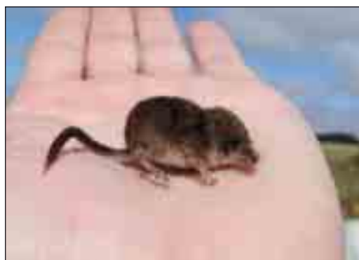
Dværgspidsmuse er med sine 2-6 g vores mindste pattedyr. Den er meget aktiv og indtager dagligt en fødemængde, som svarer til sin kropsvægt.

Nationalpark Thy er også hjemsted for et af Danmarks mest sjældne pattedyr, birkemusen. Birkemusen indvandrede til Thy kort efter seneste istid, og man antager, at senglaciertidens åbne græslandskab med spredt busk- og trævegetation har passet arten godt. Det er sandsynligvis netop denne langvarige tilstedeværelse af de åbne naturtyper evt. kombineret med en reduceret konkurrence fra andre småpattedyr, som gør, at Thy så vidt vides huser Danmarks største bestand af birkemus.