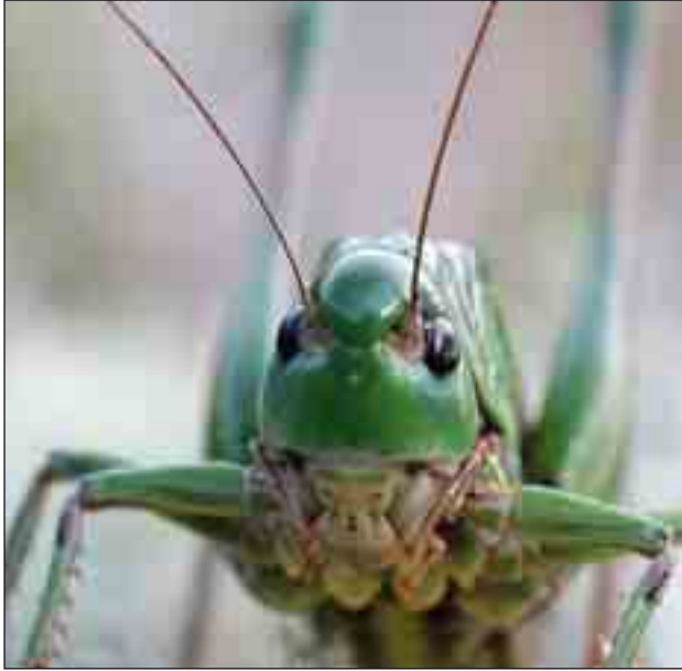
Den største af vores græshopper er vortebideren, der bliver over fire centimeter lang. Den findes mange steder i klitter og heder med lav vegetation.