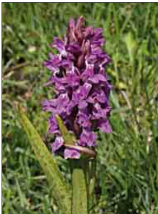
Finprikket gøgeurt er en sjælden varietet af kødfarvet gøgeurt, som vokser i de ferske enge omkring Ørum Sø.

Der er desværre fra de senere år flere eksempler på, at der i forbindelse med driften af plantagerne ikke tages det nødvendige hensyn til kendte sjældne planteforekomster. Det bør kunne gøres bedre i fremtiden, således at etableringen af