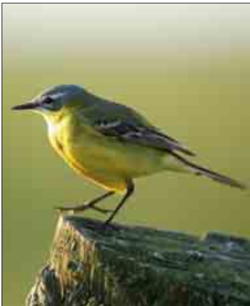
Den gule vipstjert yngler på engene på Agger Tange.

Skov- og Naturstyrelsen Thy har siden 1996 foretaget ynglefugletællinger på engene ved den store lagune. Som det fremgår af tabel 3, er det kun engfuglene, der er taget med. Der er også en skarvkoloni på ca. 500 reder i lagunen. Knopsvane, grågåås, gråand, spidsand, knarand, blichøne, hættemåge, havterne, gul vipstjert, engpiber og