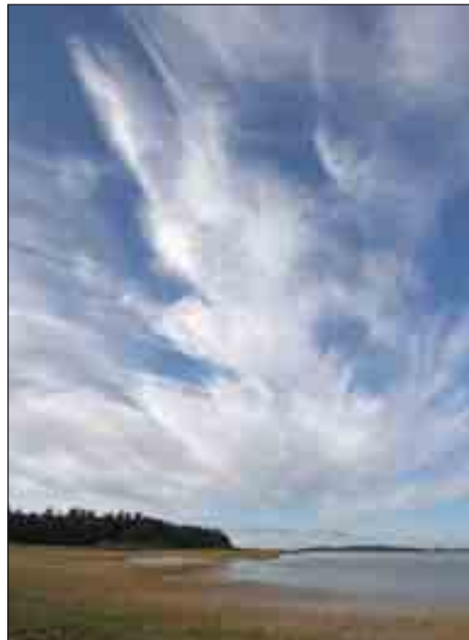
Træerne vokser ikke umiddelbart ind i himlen, selv om området bliver nationalpark. Her udsigt over Nors Sø mod Vilsbøl Klitplantage.

I forbindelse med den EU-støttede "LIFE-ordning" (der bl.a. har til formål at genoprette og bevare truede naturtyper i EU) er der, bl.a. i Thy i årene 2001 – 2005, blevet foretaget betydelige rydninger af træer og anden naturpleje på de åbne klitarealer. Der var imidlertid tale om en engangsydelse, og det økonomiske grundlag for en fremtidig naturpleje i området er herefter meget usikker, såvel på de privatejede som på de statsejede arealer. Med områdets nye status som nationalpark må området forventes at få tilført de nødvendige midler, der skal til for at opretholde arealerne i optimal tilstand.