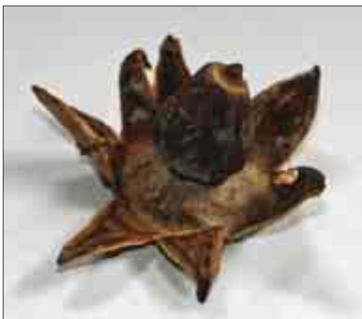
Tørret eksemplar af liden stjernebold. Fundet på den store P-plads ved Kystvejen – Hanstholm Vildtreservat - 1993.

Vi er dog ikke på helt bar bund. Thy har ofte haft besøg af professionelle mykologer, som har beriget os med udførlige svampelister over deres fund, og lokalt er det især Birgit Nordentoft Nielsen,