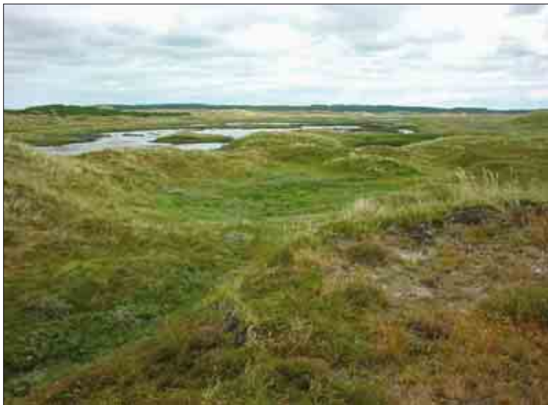
Hanstholm Vildtreservat med grå klit, tør og fugtig klithede, klitsøer samt klitplantage.

På det meste af strækningen langs Vesterhavet består de yderste klitpartier af et bælte med hvid klit i varierende bredde. Her ligger det ”hvide” sand helt eller delvist blottet, så det fortsat kan flyge. Herefter følger oftest områder med grå klit, som er kendetegnet ved at være stabile og vegetationsdækkede klitområder, som dog ikke er domineret af dværgbuske. Er området domineret af dværgbuske, er der tale om klithede, som dels kan være en tør type med revling, hedelyng m.fl.