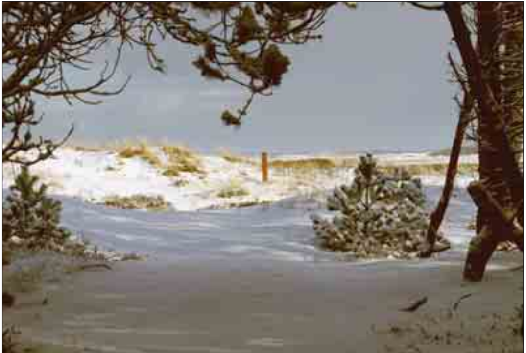
Vinter i nationalparken.

på bekostning af de meget naturfattige bjergfyrbekovninger mod vest.