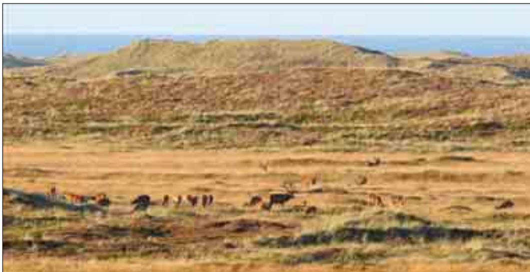
Kronhjorte i klitheden.

myndigheder og reagerer derfor forståeligt med en vis skepsis. Processen med ”det blanke papir” har både virket tillidsskabende og afskrækkende på lodsejere, der er en meget uhomogen gruppe. Typisk ønskes garantier på lang sigt, som ingen kan stille.