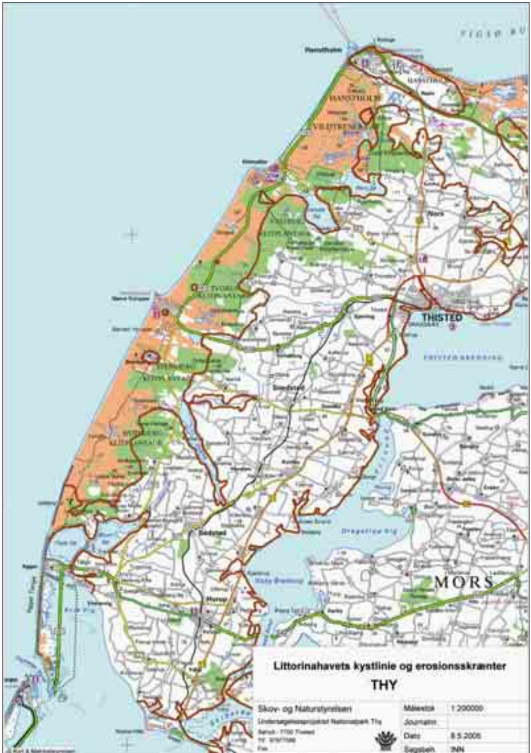
Kortet over Littorinahavs kystlinie giver samtidig et indtryk af den arealmæssige store udstrækning af de hævede havbundsarealer.